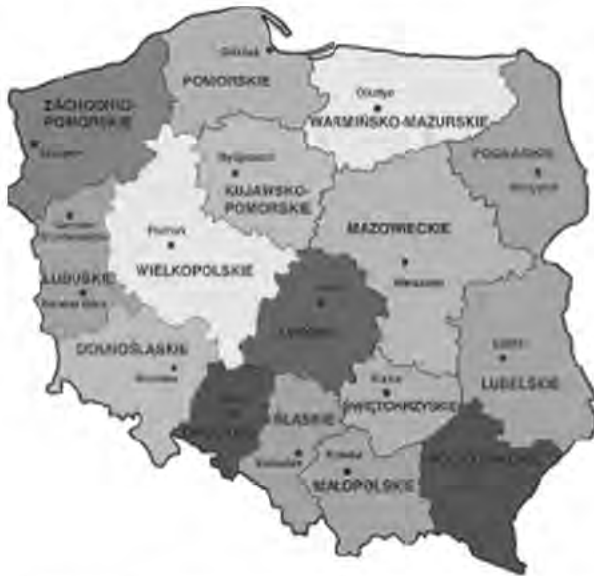
Rys. 3. Podział administracyjny Rzeczypospolitej Polskiej na województwa